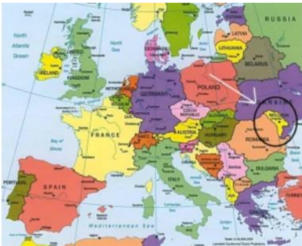
De ligging van Moldavië in Europa

Movu Moldova richt zich vooral op de plattlandsgebieden in de kleinere dorpen omdat we zien dat de armoede daar het grootst is en de noodzakelijke ontwikkelingen en verbetering van leefomstandigheden daar het hardste nodig zijn. Nog specifieker zijn de meeste plaatsen van onze hulpprojecten in het Zuidwesten van Moldavië in de regio Cahul. Uit oogpunt van efficiency, doelmatigheid en noodzaak en bestaande contacten.