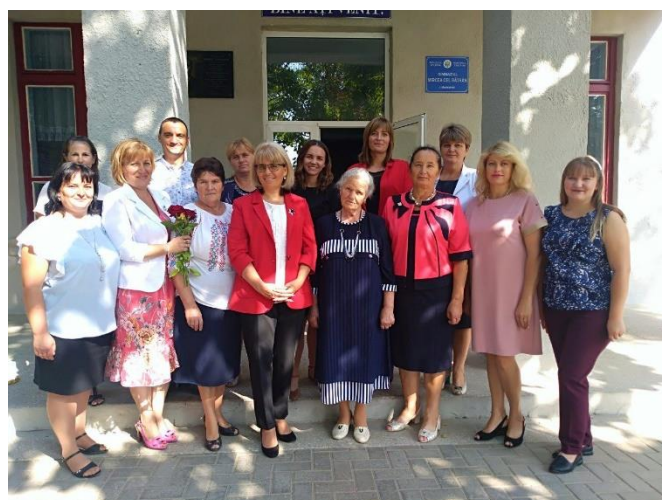
Voltallig personeel Gymnaziul Mircea Cel Batran