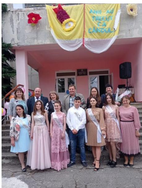
Docenten en leerlingen bij diploma uitreiking