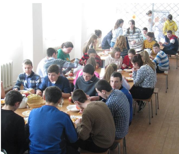
Maaltijdprojecten Gymnaziul Vladimir Corolenco

De ondersteuning bestaat uit het financieren van warme maaltijden tijdens de lunch voor kinderen waarvan de ouders / verzorgers de eigen bijdrage niet kunnen betalen. Inmiddels krijgen 50 kinderen tijdens schooltijd van maandag t/m vrijdag een warme lunch aangeboden. Deze wordt verzorgd door de kokkinnen van de scholen en biedt deze dames daarmee ook weer een stukje werkgelegenheid. Verder mochten we in afgelopen jaar o.a. Schoolmeubilair, TV's, Schoolborden en Sportmatrassen afleveren.