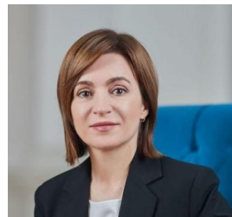
Maia Sandu: President Moldavië

Het is hoopgevend dat tijdens de Presidentsverkiezingen van december 2020 duidelijk een nieuwe koers lijkt te zijn ingeslagen met Maia Sandu als de nieuwe president van Moldavië. Zij is sterk West-Europees georiënteerd en heeft een duidelijke hervormingsagenda. Zij wil met haar partij PAS (Partij van Actie en Solidariteit) de corruptie, die het land al jarenlang teistert, voortvarend bestrijden en het land economisch hervormen. Zij kent de schrijnende